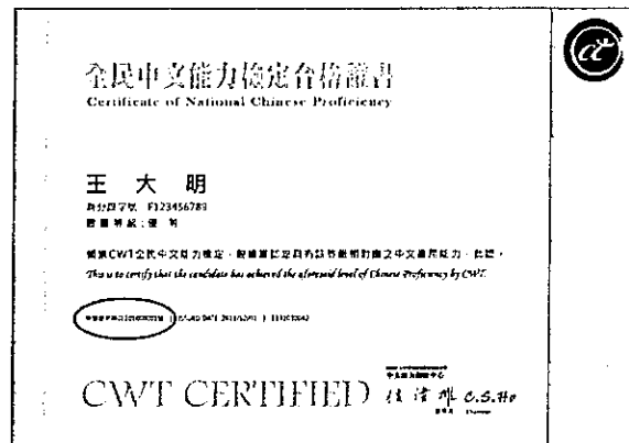
※高、優等證書證號示意圖